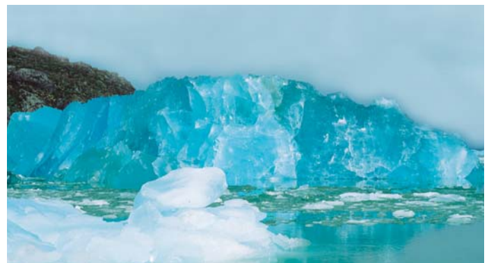
Glaciar Pío XI