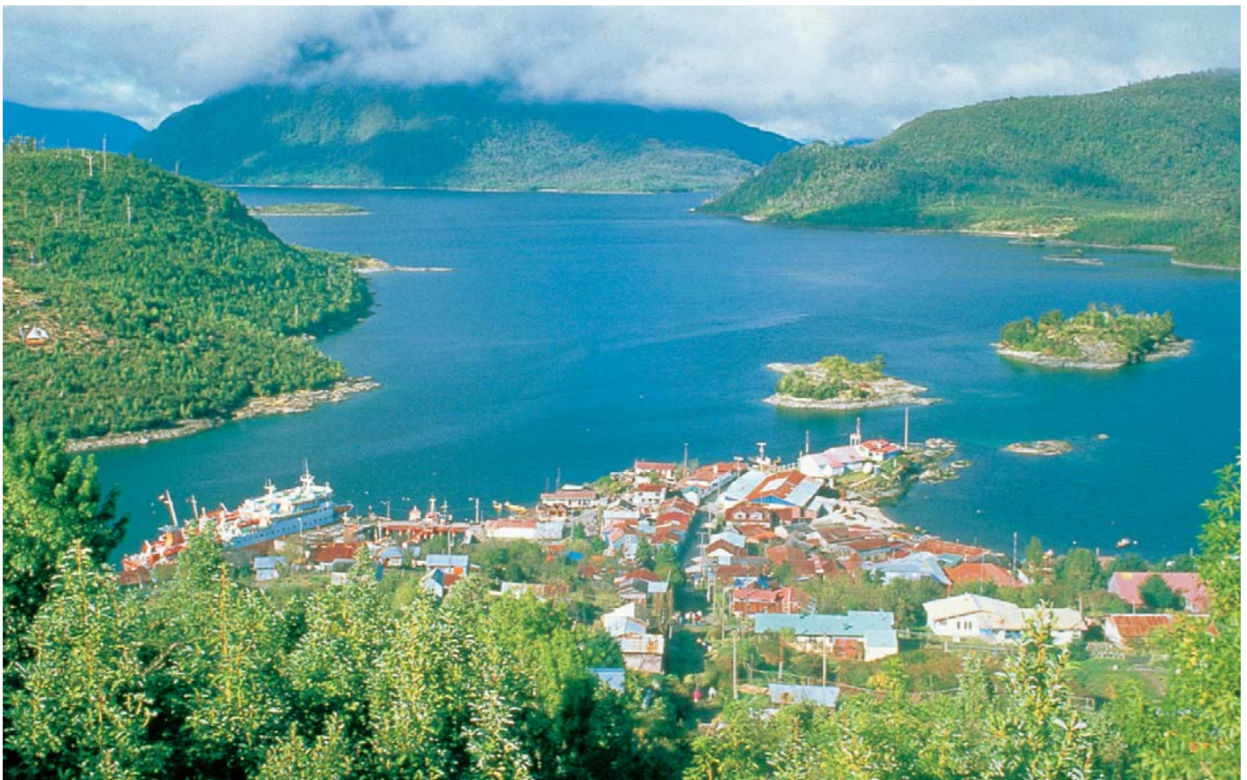
Vistas de las ciudades Puerto Montt, Calbuco y la aldea de Puerto Aguirre.