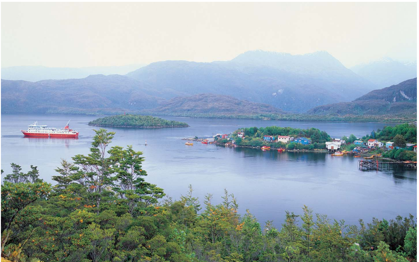
Glaciar Bernardo y Puerto Edén.