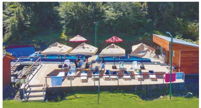
Fiordo de Quitrалco